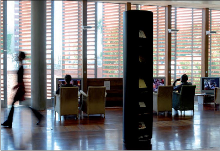
La médiathèque José-Cabanis, à Toulouse

réclamaient des consoles. Nous disposons d'une petite salle de travail que nous avons alors décidé de dédier aux jeux.