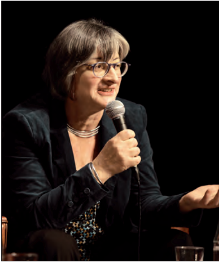
Christine Péclard

dont nous avons acquis les droits de consultation sur place. Ils utilisent également de façon intensive les cinquante postes multimédias répartis sur les différents niveaux.