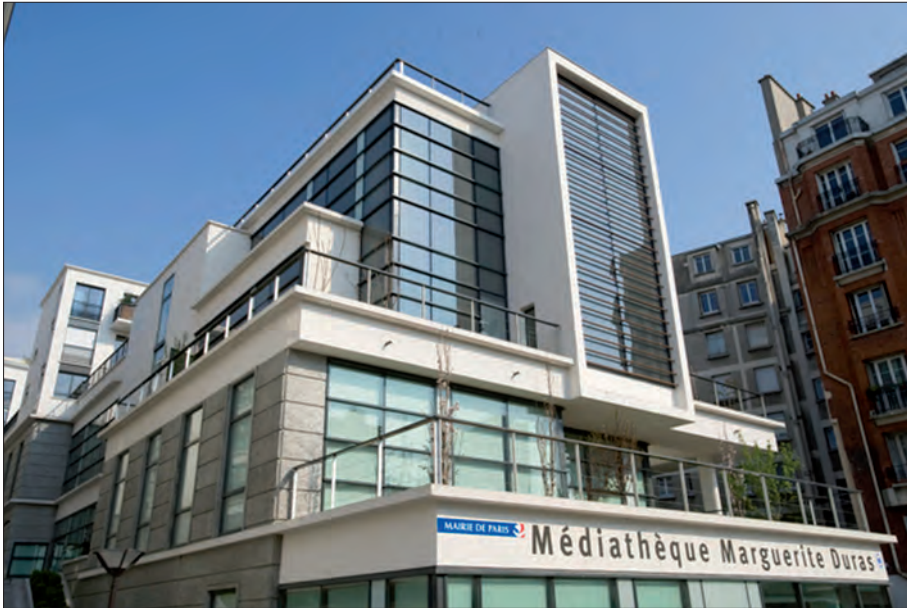
La médiathèque Marguerite-Duras, à Paris

avons utilisé comme lieu de transition l'espace des « contes », qui mêle recueils pour adultes et albums de contes illustrés pour les enfants.