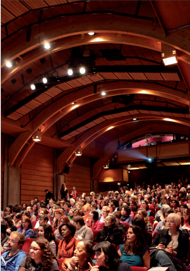
Les participants à la journée d'étude « Les adolescents à la bibliothèque » au théâtre du Vieux-Colombier le 17 octobre 2011