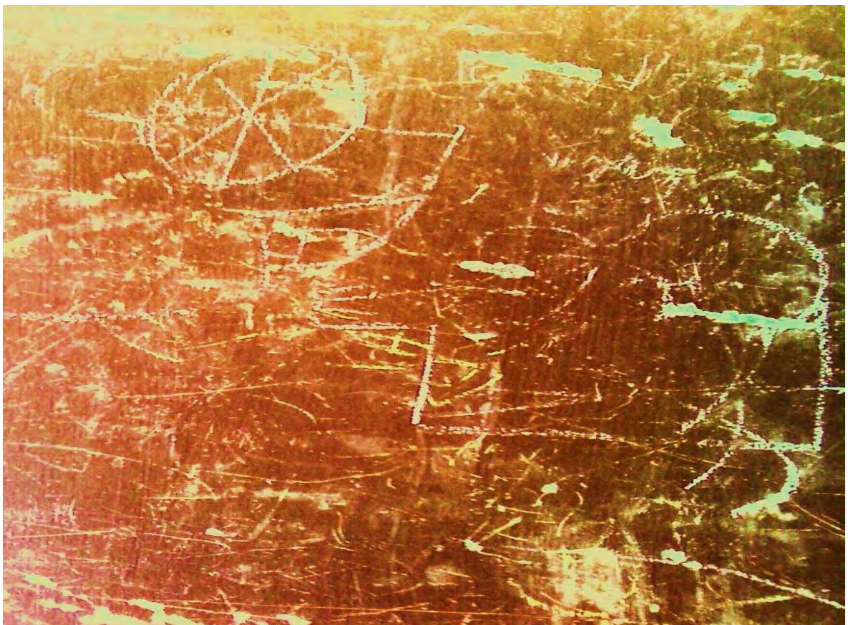
"Qui suis-je ?" – Dessin de Monsieur "Z"