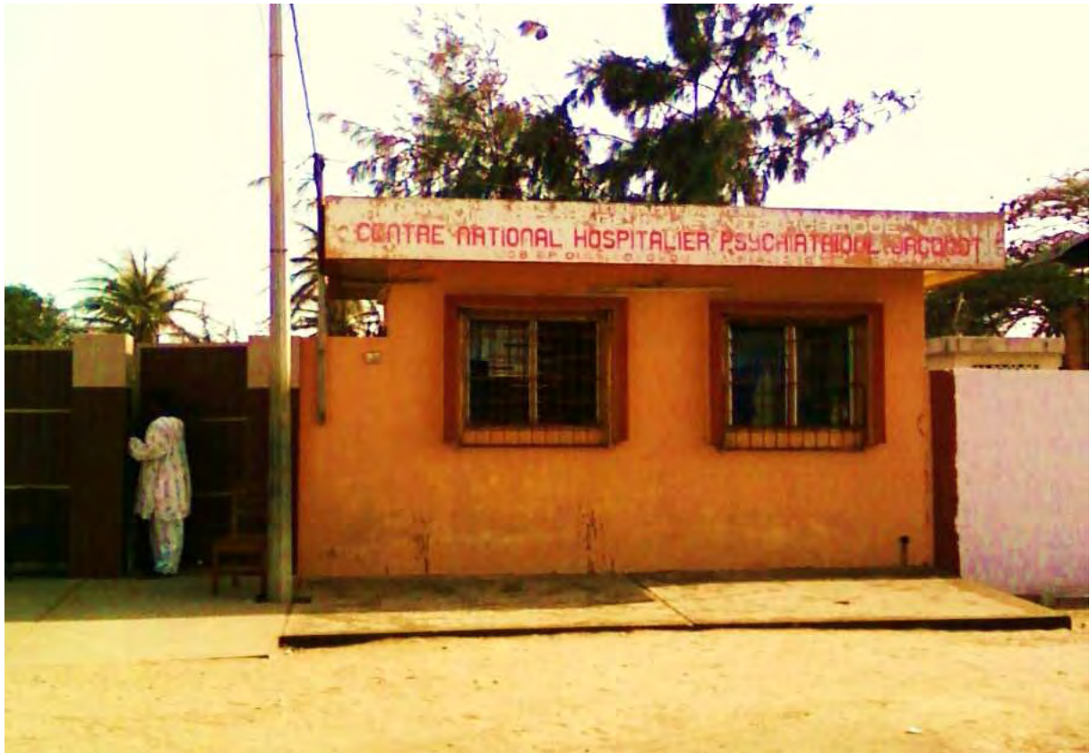
Le Centre national hospitalier psychiatrique Jacquot à Cotonou – BENIN