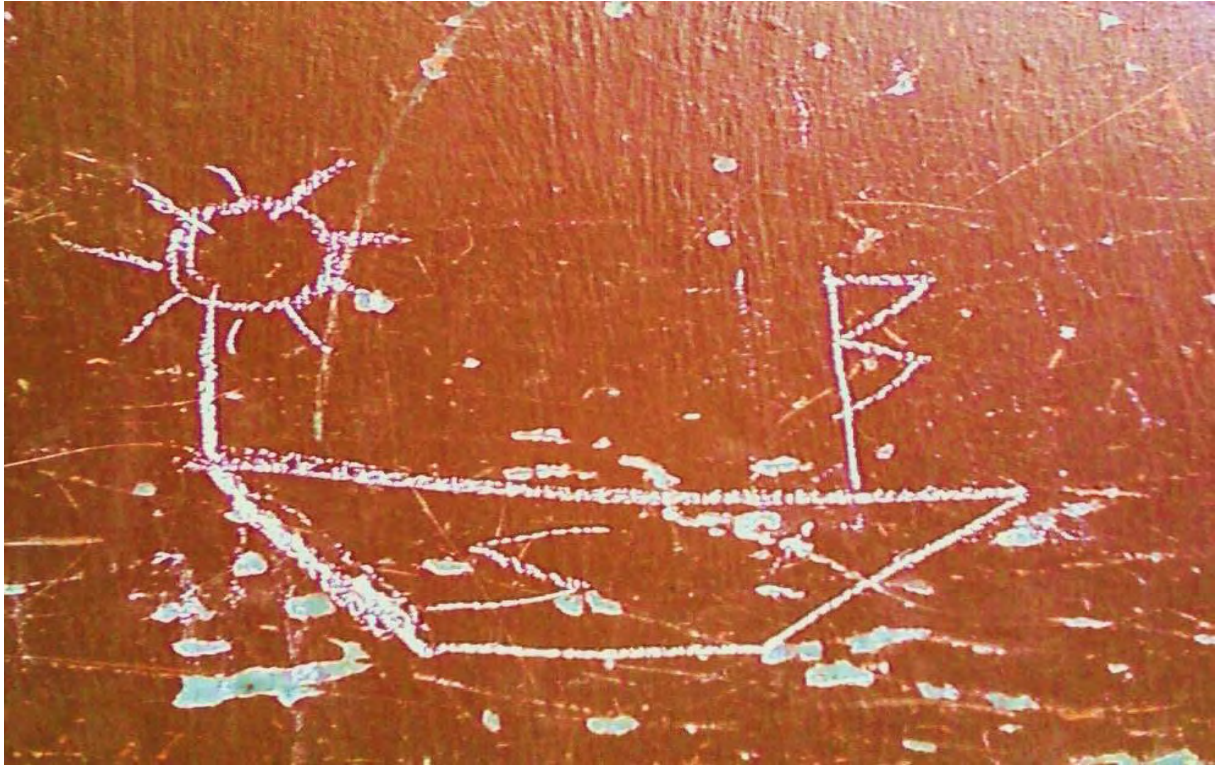
"Le "ZODIAQUE"" – Dessin de Monsieur "Z"