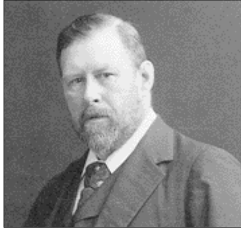
Bram Stoker

Tout y est : le vampire vit dans un cercueil, ne sort que la nuit et se nourrit du sang de ses victimes, que la morsure, aux connotations très ouvertement érotiques, contamine à leur tour. Il craint l'eau bénite et, en Roumanie seulement, l'ail ; il a le pouvoir de se transformer en animal, rat ou loup-garou, avec lequel on le confond parfois. Pour le détruire, à savoir le réduire en poussière, il faut lui enfoncer un pieu dans le cœur ou, si cela se révèle insuffisant, le décapiter.