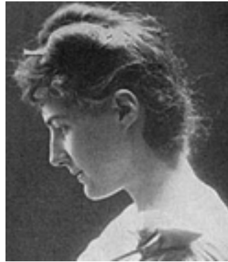
Florence Balcombe