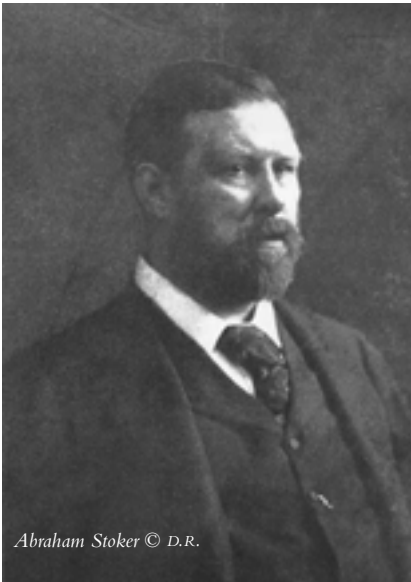
Abraham Stoker