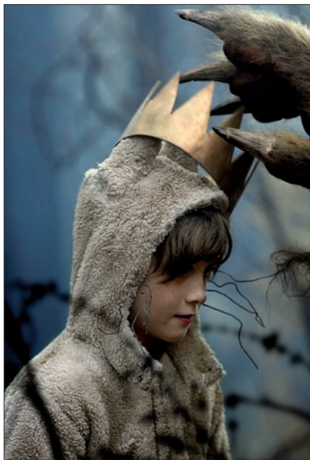
Le couronnement de Max

«Je n'ai pas cherché à faire un film pour les enfants; j'ai voulu faire un film sur l'enfance.» Cette déclaration de Spike Jonze, le réalisateur de Max et les Maximonstres , n'est pas anodine. En