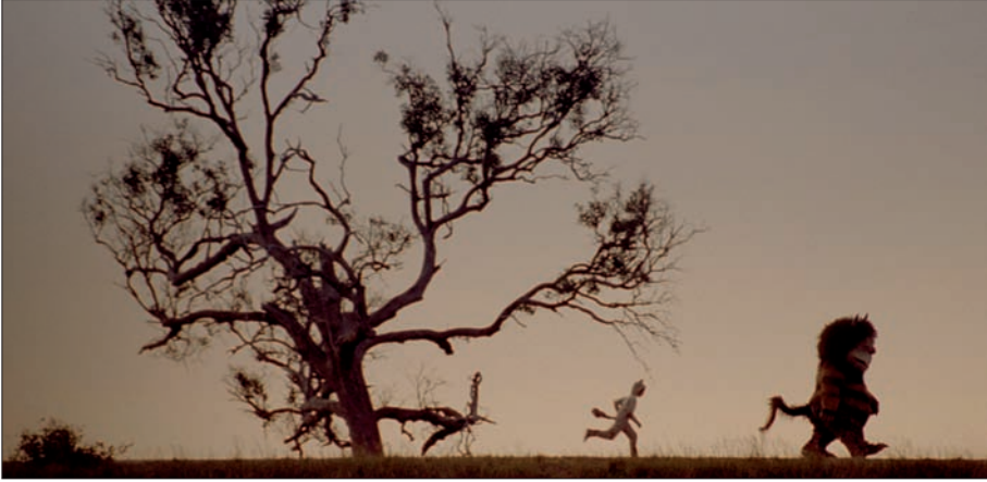
Max et Carol