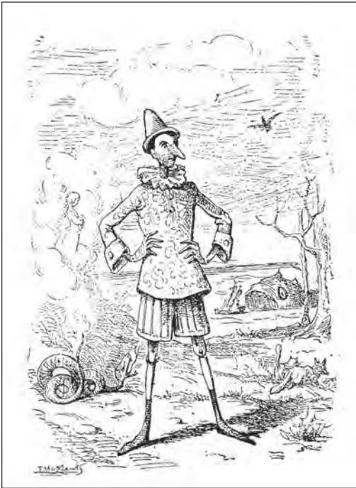
Illustration d'Enrico Mazzanti pour la première édition de «Le Avventure di Pinocchio», Florence, 1883

public, l'apostropher. Plusieurs phrases commencent par des tournures du type: « Imaginez sa surprise », « Savez-vous... », « Représentez-vous... », « Figurez-vous... », etc. Le comble de la désinvolture semble atteint avec la fin du chapitre XXIX, quand Pinocchio, revenu à de bons sentiments, est sur le point d'être transformé en petit garçon.