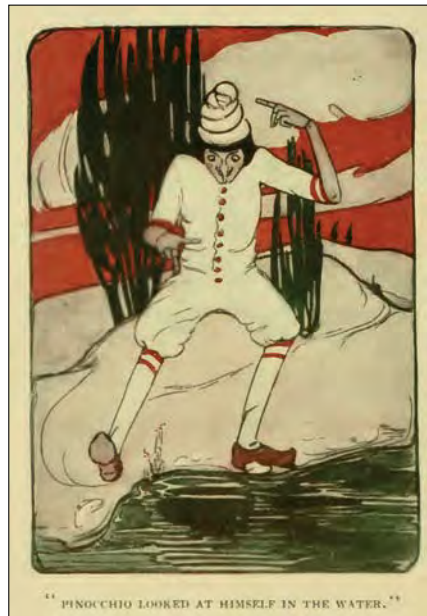
Illustration de Florence R. Abel Wilde pour « Pinocchio under the Sea », The Macmillan Company, 1913