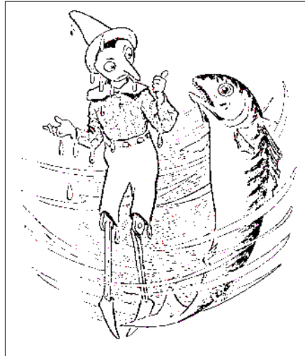
Illustration de Charles George Copeland pour « Pinocchio: The Adventures of a Marionette », Ginn and Company, Boston, 1904

Plongé dans la mer, Pinocchio retrouve son apparence de pantin. En nageant, il est avalé par le Requin géant dans la gueule duquel il retrouve Geppetto. Le vieillard est enfermé dans le monstre depuis deux ans et a survécu en mangeant les provisions d'un navire englouti dans le ventre de l'animal. Grâce à l'ingéniosité de Pinocchio, ils réussissent à quitter le corps du Requin. Le pantin, habile nageur, prend son père sur son dos et, avec l'aide d'un Thon, gagne le rivage.