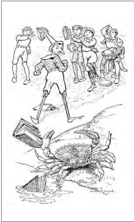
Illustration de Charles Copeland pour «Pinocchio: The Adventures of a Marionette», Ginn and Company, 1904

comme le souligne le comparatiste Alain Montandon, « met les choses à l'envers » et se veut « une histoire fondamentalement parodique, animée d'un humour tout à fait original » 8 . Notre pantin, dans une perspective carnavalesque, déjoue les plans des adultes, choisit toujours la voie la plus risquée, la plus contraire à la raison. Paul Hazard, dans une analyse qui a fait date 9 , disait qu'il est une métaphore de l'âme des enfants, en ce sens qu'il refuse de grandir, d'entrer dans un monde tourmenté et injuste. L'image que lui renvoient les représentants de l'autorité est décevante: Geppetto, sorte de père Goriot indigent, est incapable de fournir un modèle d'éducation; la Fée, se voulant tantôt mère, tantôt sœur, applique une pédagogie fluctuante et parfois perverse. Les gendarmes font de la répression aveugle et les juges condamnent les innocents. Mieux vaut tenter sa chance du côté du Champ des miracles ou du pays des