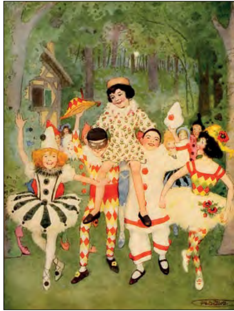
Illustration de Maria L. Kirk pour « Pinocchio, the Story of a Puppet », J. B. Lippincott Company, 1920

Dans ce domaine aussi se perçoit la malice du narrateur qui se retranche derrière un discours de sagesse tout en affichant sa sympathie, qu'il nous invite à partager, pour cet enfant insoumis, rebelle, sans mémoire. Le roman Pinocchio ,