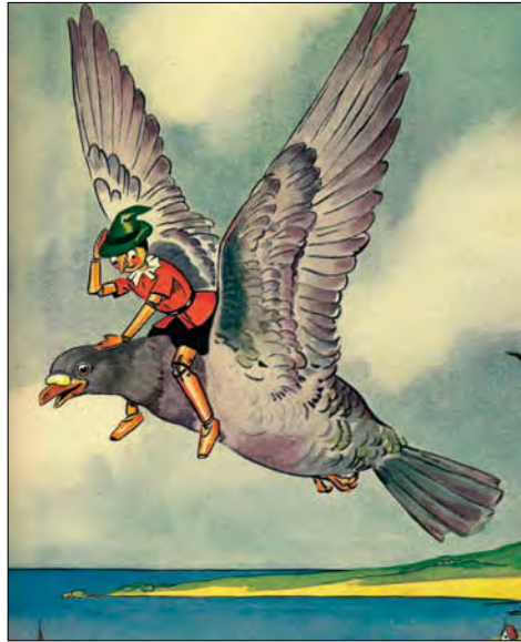
Illustration de Tony Sarg pour « Pinocchio », The Platt & Munk Company, 1940

ter de citer les essentielles. Par exemple, la lecture christique, qui fait de Pinocchio une réécriture de la vie de Jésus: Geppetto le menuisier serait Joseph (Giuseppe) le charpentier; la Fée bleue la Vierge Marie, souvent couverte d'un voile bleu; Mangefeu serait Hérode persécutant les innocents; Lucignolo ( Lumignon dans la version française), une sorte de petit Lucifer, vecteur de la tentation. Jusqu'au bestiaire accompagnant le pantin qui rappelle les animaux liés au Christ: l'âne, le grillon, le poisson, le serpent, le requin, lequel fait penser à la baleine qui engloutit Jonas. Le repas à l'auberge serait une parodie de la Cène; la fillette à la fenêtre une parodie de l'Annonciation, la pendaison une parodie de la crucifixion.