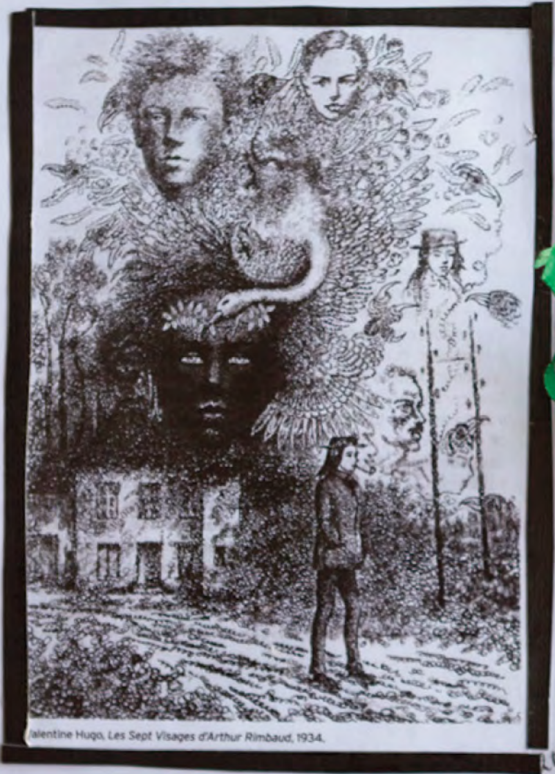
Valentine Hugo, Les Sept Visages d'Arthur Rimbaud, 1934.