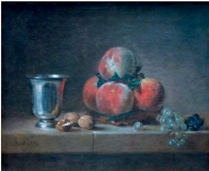
Chardin, nature morte avec pêches, gobelet d'argent, raisins et noix, 1759-1760