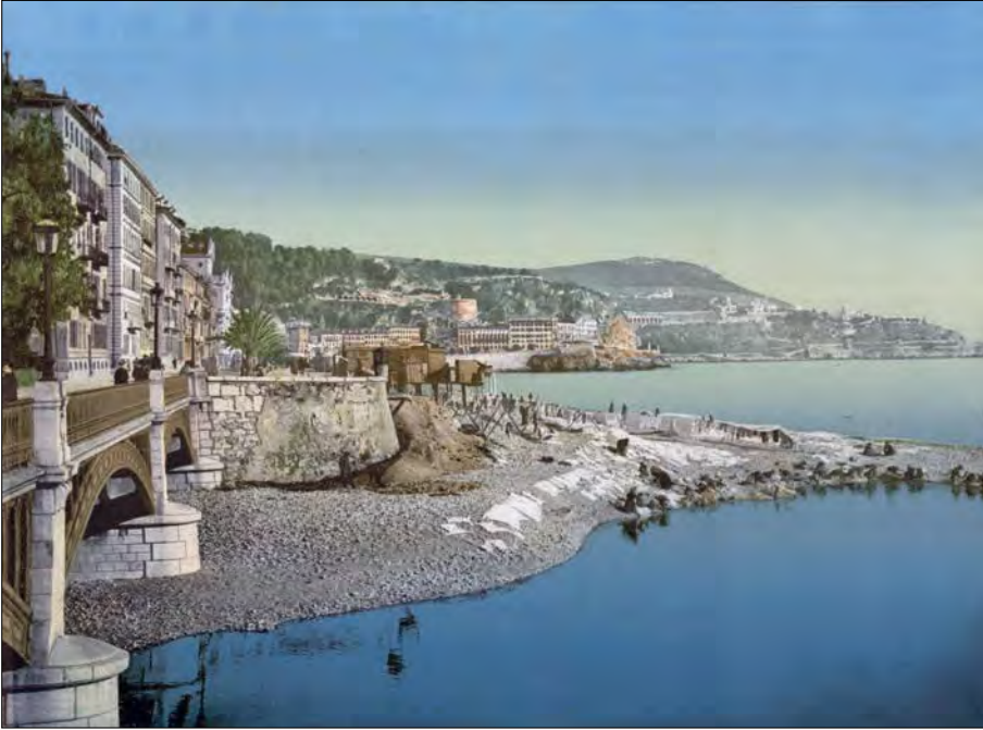
L'embouchure du Paillon sous le pont des Anges à Nice, photochrome, vers 1900

notamment ceux qui s'adressent aux adolescents, jouent sur les stéréotypes.