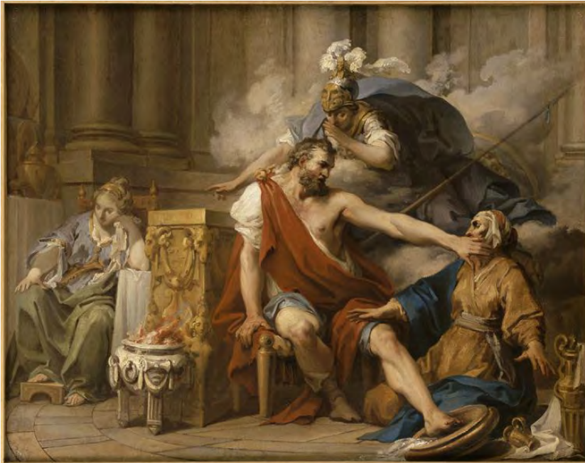
« Ulysse reconnu par sa nourrice Euryclée », huile sur toile de Clément Belle, XVIII e siècle musée des Beaux-Arts de Bayonne