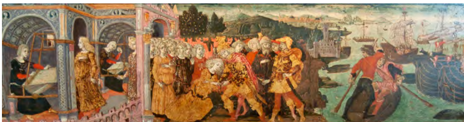
Guidoccio Cozzarelli, « Le Départ d'Ulysse », panneau de coffre, musée national de la Renaissance, château d'Écouen