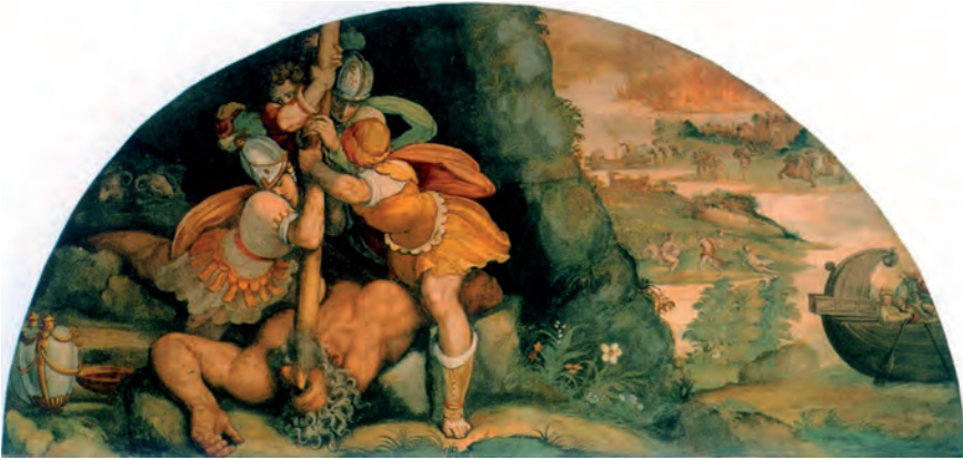
Alessandro Allori, « L'Aveuglement de Polyphème », fresque, 1580, palais Salviati, Florence