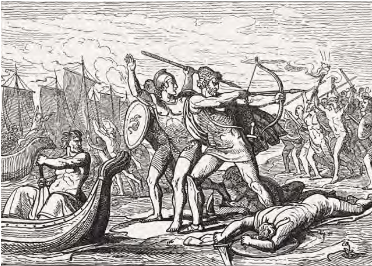
Ulysse contre les Cicones, gravure, 1880