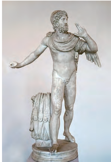
« Ulysse, roi d'Ithaque », statue romaine, 138-192 ap. J.-C. Musée archéologique, Venise