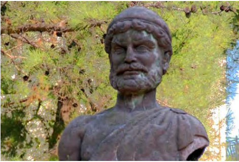
Statue d'Ulysse à Stavros (Ithaque)

Dans le passage de la page 128 de « Léiôdès » à « prétendants », on relèvera les formes pour les analyser. On ajoutera pour l'imparfait la valeur itérative (répétition ou habitude) de « s'asseyait » et de « s'indignait ».