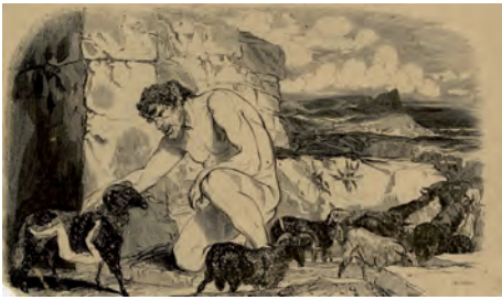
Ulysse s'échappe de la grotte de Polyphème, gravure du XIXe siècle

tissant sa toile. Cette qualité permet à Ulysse d'échapper aux périls qu'il affronte. Pris au piège par le Cyclope dans sa grotte, il réfléchit et invente un stratagème (« Je restai à me demander comment je pourrais me venger », p. 49). Le piège est construit : tailler le pieu, enivrer Polyphème, prétendre s'appeler Personne, crever l'œil, fuir sous les moutons.