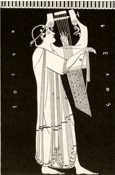
L'aède Phémios - 1951. Gravure d'après une amphore

Phémios, dans sa supplique à Ulysse, se nomme « chanteur des dieux et des hommes » (p. 143). Il est inspiré par un dieu. Ulysse l'épargne car c'est « de force qu'il avait dû chanter pour le prétendant » (p. 143). À travers ce personnage, on reconnaît l'aède Homère ; l'aède est la conscience et la mémoire des hommes, il ne peut trahir. Le poète se pose en relais entre les dieux et les mortels. Par sa bouche, ces derniers apprennent les exigences des dieux dont il est en quelque sorte l'interprète.