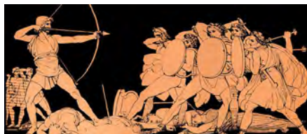
Ulysse tuant les prétendants

Les retrouvailles du couple sont précédées par une fête (dernière ruse d'Ulysse) afin que tous en Ithaque croient aux noces de Pénélope et d'un prétendant. En réalité, ces chants, ces danses annoncent la réunion des époux qui goûtent comme à un second mariage.