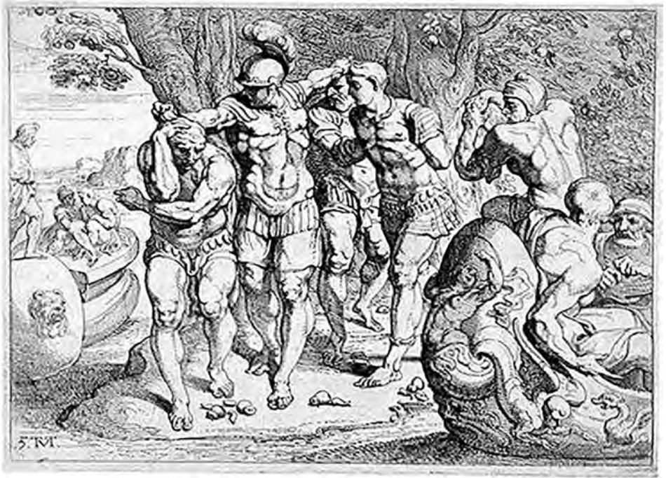
Ulysse chez les Lotophages, gravure française du XVIII e siècle